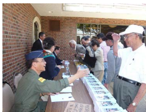
Quang cảnh hội trường * Chụp hình kỷ niệm * GS Vinh ký tên trên những quyển sách cho quan khách