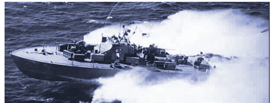
Fast PT Boat trên đường hành quân Vịnh Bắc Việt

Địa chỉ liên lạc: Ủy Ban Xây Dựng Tượng Đài Florida P.O. Box 277625, Miramar, FL 33027-7625 hoặc Website: http://www.tuongdaiflorida.com