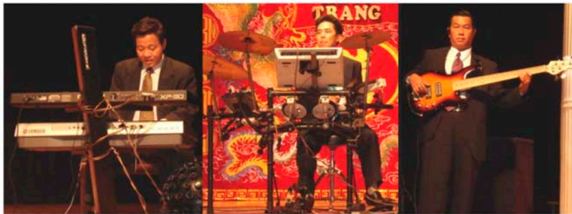
Ban nhạc Thùy Dương

Quý vị sẽ thưởng thức Chương trình Văn Nghệ & Dạ Vũ Đặc Sắc